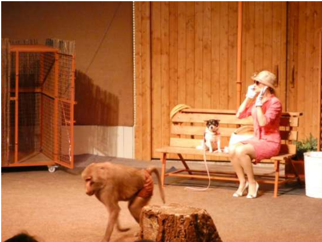
Fotografieren verboten. Na ja ...