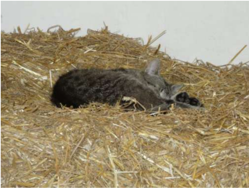
Dier ersten hatten sich bereits hingelegt

Irgendwann waren alle geschafft und wir traten die (kurze) Heimreise an. Nicht ohne das Versprechen, wiederzukommen.