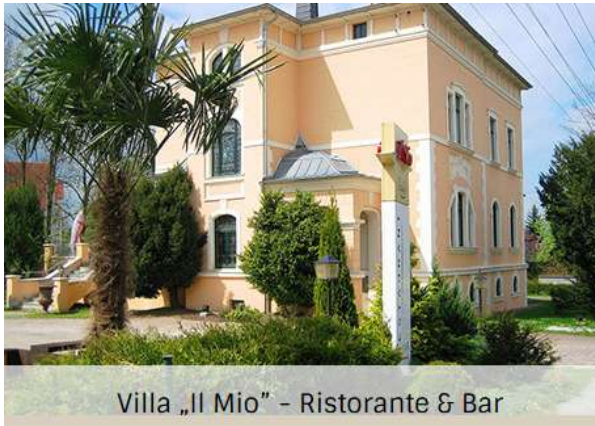
Villa „Il Mio“ - Ristorante & Bar